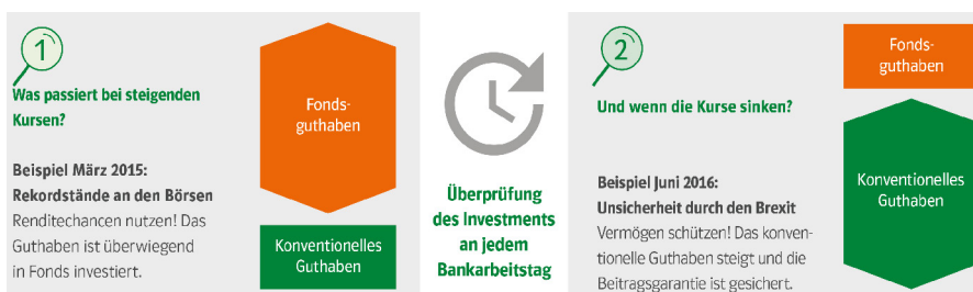
Abbildung 1: An den Kapitalmärkten gibt es Schwankungen. WWK IntelliProtect® reagiert hier mit einem eigenen iCPPI-Modell. Welche Auswirkungen die beiden Beispiele auf die Renditen hatten, zeigt Abbildung 2.