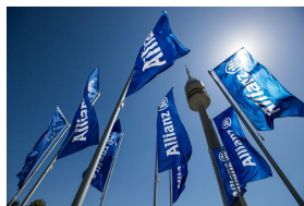
Allianz Leben reagiert auf die Zinsflaute