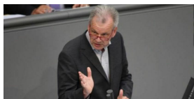
Weinberg (Die Linke): "Die PKV muss abgeschafft werden, um die Zwei-Klassen-Medizin zu überwinden"

Schlagwörter: Lebensversicherer , Lebensversicherung