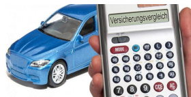
Gehen die Huk und die Allianz in die Offensive gegen Check24?