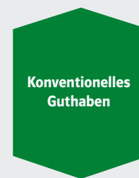
Vertragsguthaben in EUR